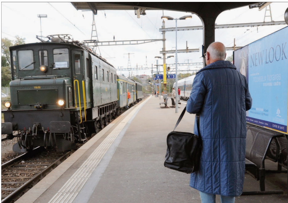
La locomotive de 1932, et ses deux wagons, entre en gare de Nyon. Place désormais aux manœuvres pour accéder au réseau non-électrifié qui mène à Marens, par la route du Stand.

C'est que, si ce train est sorti d'usine dès 1929, il fut encore en circulation jusque dans les années 1990.