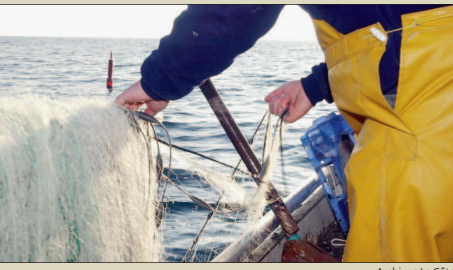
Archives La Côte

■ Le tonnage de poissons pêchés dans le Léman en 2008 est en hausse. Sauf pour la truite et l'omble. Explications. p.5