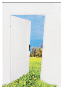
PUB Le projet des Dentellières se vend nature.

La Ville avait venu la peau de l'ours et commencé de creuser aux Dentellières pour la construction de 31 unités d'habitation (lire notre édition d'hier). Mais c'est formellement jeudi soir que le Conseil général a donné son accord à la vente des parcelles en pleine propriété (75 fr. le mètre carré). Même les libéraux-radicaux ont passé sur l'entorse au règlement. Dans la foulée, sept parcelles en droit de superficie au chemin des Aulnes, au-dessus de la Jambé-Ducommun, ont également été vendues plein pot (65 fr. le mètre carré). /ron