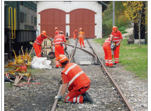
LA DOUANIÈRE Les apprentis de Log'in lors des travaux d'entretien de voie au dépôt du Locle.

Le site du dépôt ferroviaire La Douanière, au Locle, a été l'objet d'importants travaux d'entretien du faisceau de voies. Une équipe d'apprentis de Log'in, entreprise formatrice de tous les métiers ferroviaires de Suisse, a été engagée du 28 septembre au 22 octobre pour remettre à niveau les voies du dépôt.